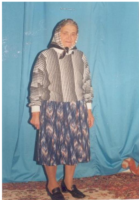
PROGRAMUL SURORILOR DIN OASTEA DOMNULUI