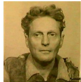
Poză a pastorului Richard Wurmbrand în timpul detenției la Jilava.