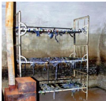
Celula de închisoare cu paturi suprapuse,, fără saltele, pe care deținuții erau obligați să doarmă. Soba, doar de decor, niciodată încălzită în zilele geroase de iarnă