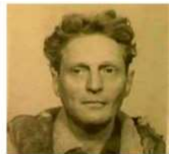
Fotografie a pastorului Richard Wurmbrand în timpul detenției la Jilava