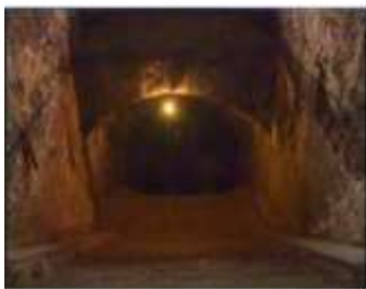
Închisoarea comunistă Jilava. Intrarea spre celulele subterane.

Contemporanii lui Iisus au fost "uimiți de învățătura Sa" (Marcu 1:22). Învățătura Sa era simplă și îți schimbă viața. Căci Iisus le-a spus ucenicilor: " Dacă voiește cineva să vină după Mine, să se lepede de sine, să-și ia crucea și să Mă urmeze." (Matei 16:24). În mijlocul templului, înconjurat de mulțime, El a îndemnat pe unul și pe toți: "Luați jugul Meu asupra voastră și învățați de la Mine " (Matei 11:29). Iisus a spus: " Căci de oricine se va rușina de Mine și de cuvintele Mele, se va rușina și Fiul omului de el, când va veni în slava Sa și a Tatălui și a sfinților îngerii." (Luca 9:26) De-a lungul vremii, adepții lui Iisus au uimit lumea cu dorința lor de a se sacrifica pentru credința creștină. Frații noștri torturați sub dictatura comunistă au putut îndura ura și tortura. Ei nu se rușinează de Cuvântul Său. Viața lor este lucrarea lui Dumnezeu. Susținând dăruirea și sacrificiul lor creștin, aducem slavă lui Dumnezeu.