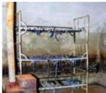
Celulă cu paturi suprapuse, fără saltele, pe care deținuții erau obligați să doarmă. Soba, doar de decor niciodată încălzită în nopțile geroase de iarnă.