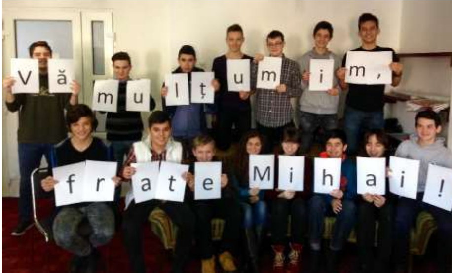
Un gest de mulțumire din partea elevilor Colegiului Richard Wurmbrand pentru donatori

“Religia curată și neîntinată înaintea lui Dumnezeu, Tatăl nostru, este să cercetăm pe orfani și pe văduve în necazurile lor și să ne păstrăm neîntinați de lume.” (Epistola Apostolului Iacob 1:27)