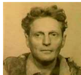
Fotografie a pastorului Richard Wurmbbrand în timpul detenției la Jilava