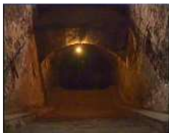
Închisoarea comunistă Jilava. Intrarea spre celulele subterane.