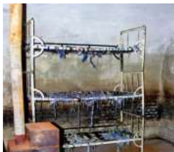
Celulă cu paturi suprapuse, fără saltele, pe care deținuții erau obligați să doarmă. Soba, doar de decor, niciodată încălzită în nopțile geroase de iarnă